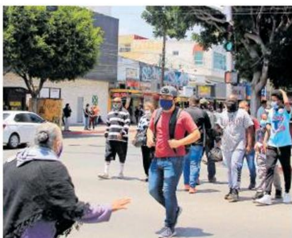
A nivel estatal, se reportaron 178 casos nuevos del Covid-19

La vacuna de AstraZeneca y la Universidad de Oxford está en pausa, pero ya hay un plan B. Se trata de la vacuna Sputnik V, fármaco ruso que se espera llegue en noviembre luego de que la farmacéutica mexicana Landsteiner Scientific adquiriera 12 millones de dosis contra el coronavirus Covid-19. El presidente Andrés Manuel López Obrador explicó que pese a la pausa en los ensayos de la vacuna de AstraZeneca, hay la garantía de que México tendrá el medicamento. Págs. 6 y 10